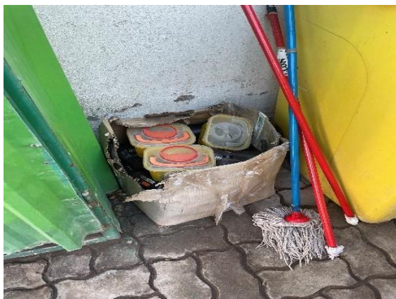
Imagen N°1: Desechos cortupunzantes guardados en una caja de cartón.