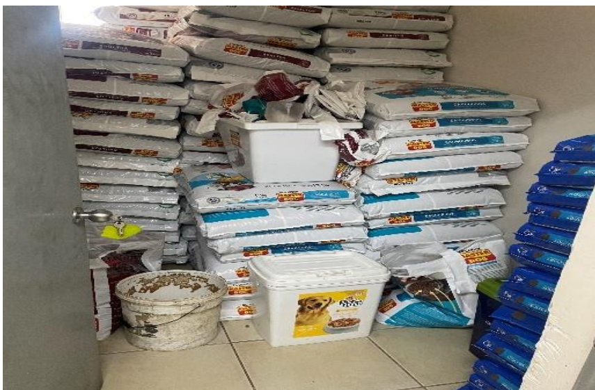
Imagen N° 1: Alimento para perros almacenados a ras del suelo