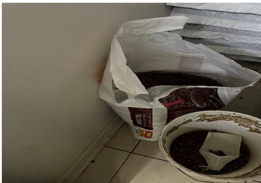
Imagen N° 2: Bolsas de alimento abierto y contenedores sin tapa.