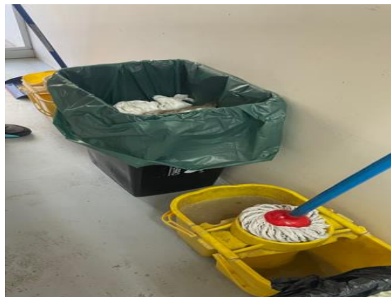
Imagen N°2: Heces de animales de pre y post operatorios