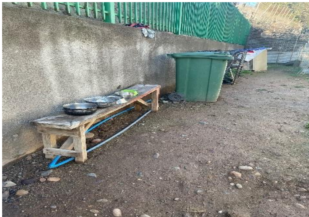
Imagen N°1: Cádaveres de animales resguardados en un contenedor.