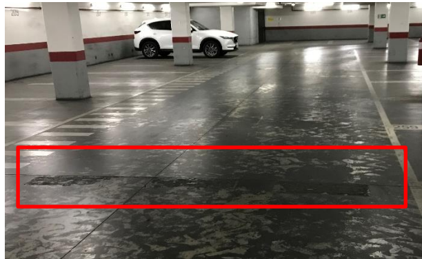
Fotografía N° 3. Ausencia de resaltos. Sector estacionamiento N° 260.