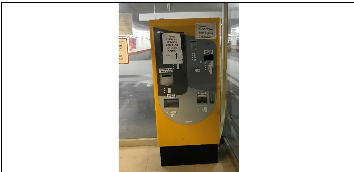
Fotografía N° 5. Cajero fuera de servicio.