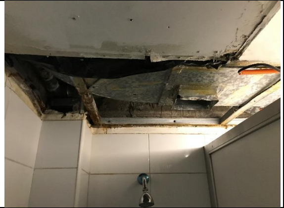
Fotografía N° 2. Cielo en estado de deterioro y desprendido en baño varones (personal).