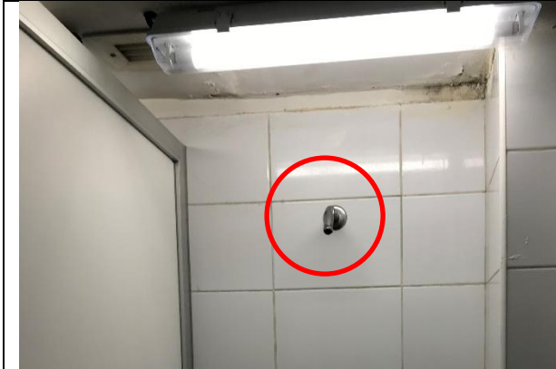
Fotografía N° 1. Ausencia de accesorio de ducha en baño damas (personal).