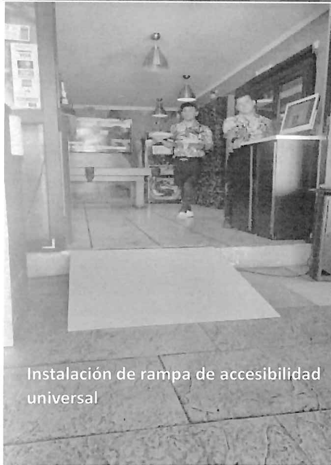
Instalación de rampa de accesibilidad universal

Instalación de Estacionamiento privado de uso universal en proceso de pavimentación