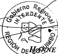
HANNE UTRERAS PEYRIN Intendenta Regional Gobierno Regional de Coquimbo