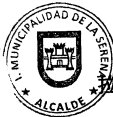
智利共和国 拉塞雷纳市代表