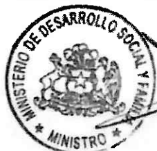
KENNETH GIORGIO JACKSON DRAGO MINISTRO DE DESARROLLO SOCIAL Y FAMILIA

ANÓTESE Y COMUNÍQUESE "POR ORDEN DEL PRESIDENTE DE LA REPÚBLICA"