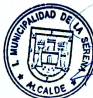
JOSÉ MANUEL PERALTA LEÓN ALCALDE DE LA SERENA (S)